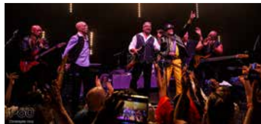
BB&Q Band / Christophe Vico