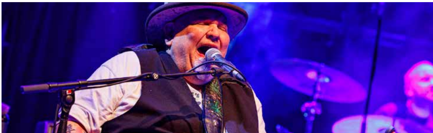
Popa Chubby / Christophe Vico