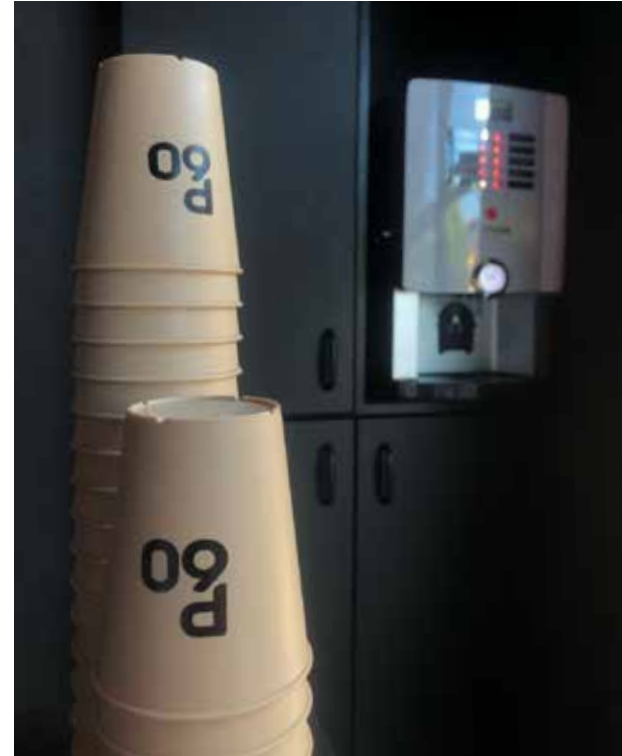
Herbruikbare P60 koffiebekers

Uit onderzoek blijkt dat de organisaties die hun positie gebruiken om voor de omgeving relevante maatschappelijke doelen te verwezenlijken, een sterkere positie innemen dan organisaties die dat niet doen.