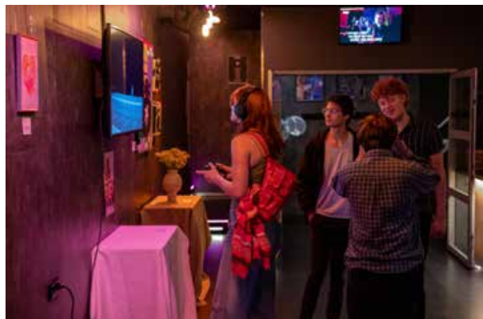
Vibrant Volume Festival / Beau de Haas