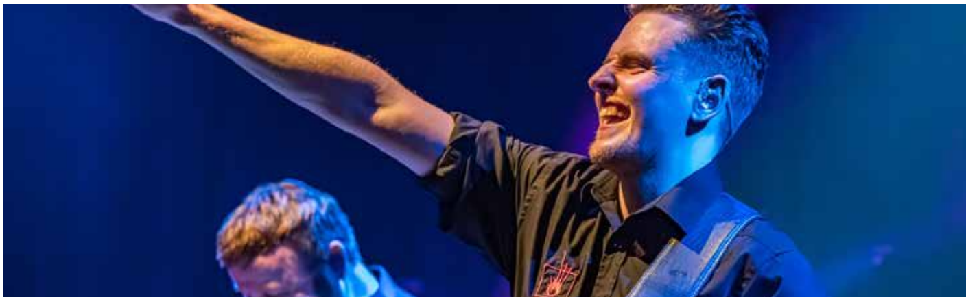
Red Hot Chilli Pipers / Rob van Dalen