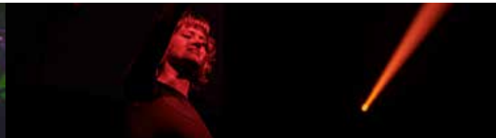
P60's Radar - MLHA / Paul Gabel