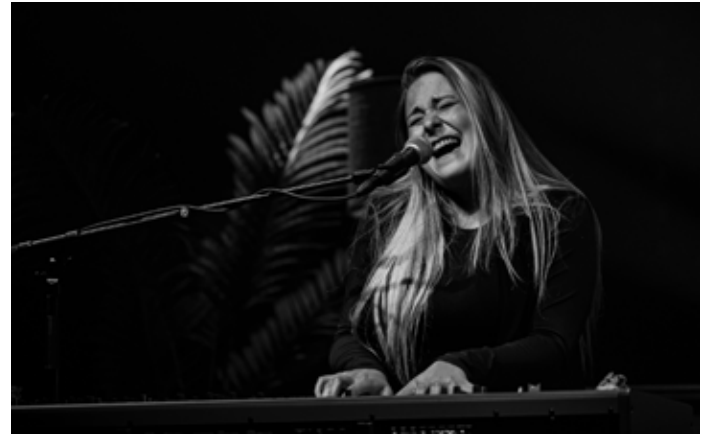
Hilin's Livingroom Sessions - Hilin / Christophe Vico