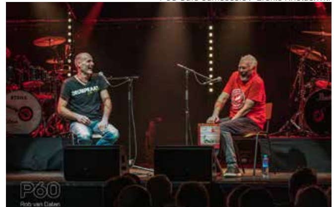
Drumpraat on Tour / Rob van Dalen