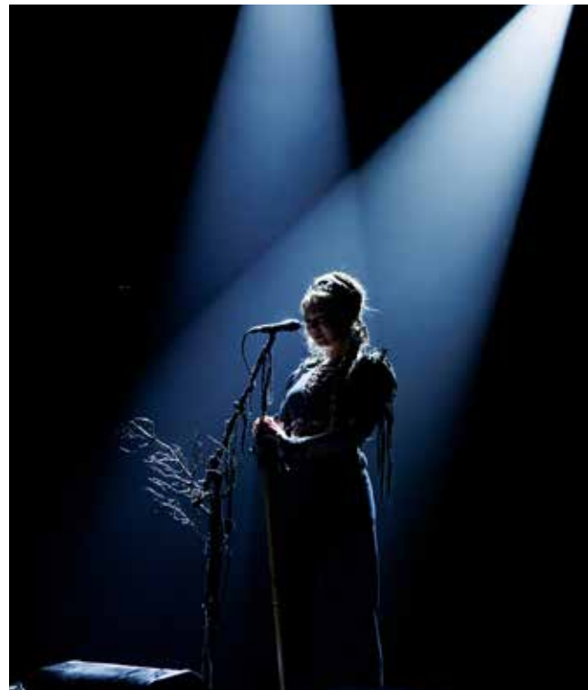
Meidi Goh & Waldkauz / Christophe Vico

De stand van de weerstandsreserve per 31-12-2024 is € 86.433 Euro (2023: € 83.632).