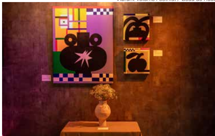
Vibrant Volume Festival