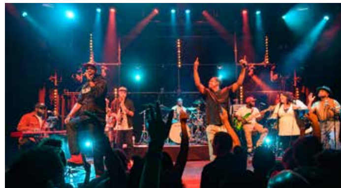
Giovanca & Friends / Paul Gabel

Vanzelfsprekend hebben we onze medewerking verleend aan de Lentemarathon door het café als plaats voor vrijwilligers in te richten en de intocht van Sinterklaas te faciliteren.