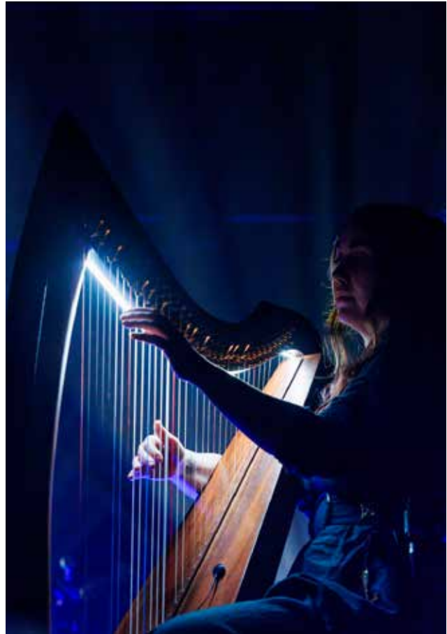
Sowulo / Christophe Vico