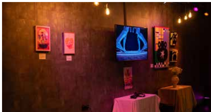
Vibrant Volume Festival

Er waren diverse exposities te zien, variërend van foto's tot schilderijen.