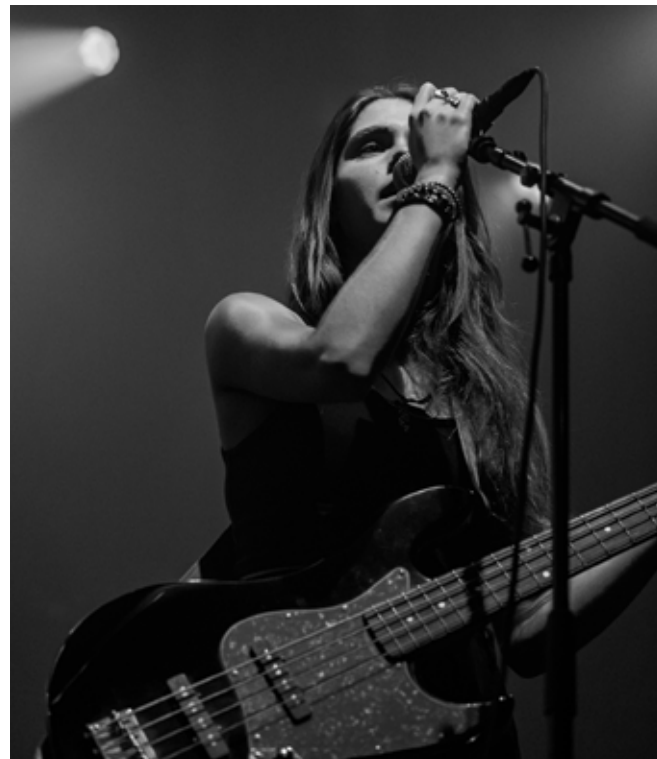
P60's Radar - KASETO / Christophe Vico