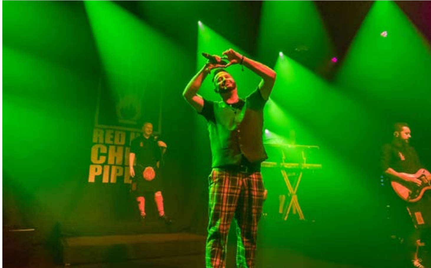
Red Hot Chilli Pipers / Rob van Dalen