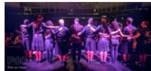
Red Hot Chili Pipers

*Afhankelijk van het programma en verhuur kan begin- en eindtijd anders zijn.