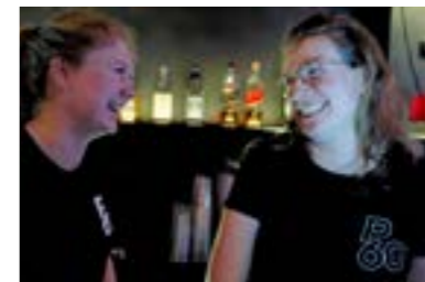
P60 Vrijwilligers / Christophe Vico