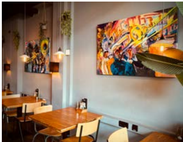
Expositie Liesbeth Schouten

Er waren diverse exposities te zien, variërend van foto's tot schilderijen.