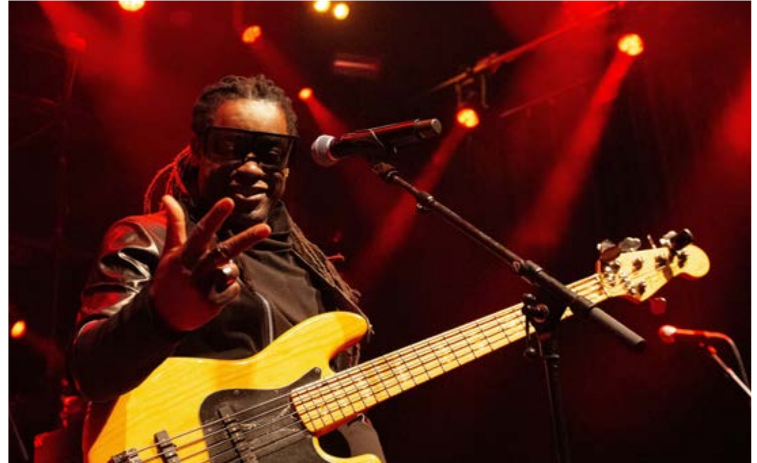
Rootsriders / Marc van der Maas