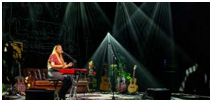
Hilin's Livingroom Sessions / Christophe Vico