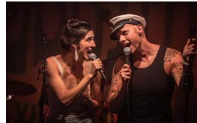
Boss Capone & Patsy / Hans Schoot