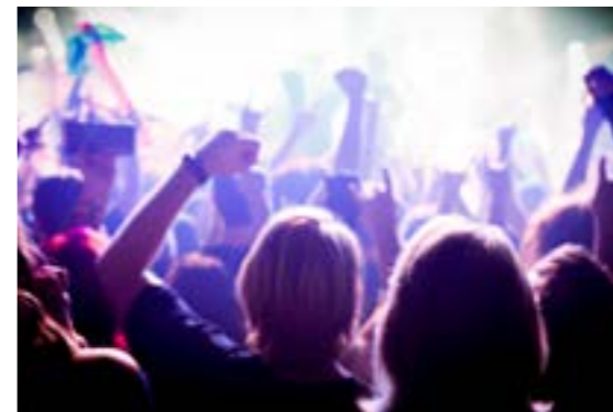
Wind Rose / Herman Helsloot

p60.nl facebook.com/poppodiump60 instagram.com/p60amstelveen youtube.com/poppodiump60