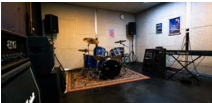
Oefenruimte 1 / Antoine Julien

In samenwerking met Amstelring organiseren we regelmatig activiteiten voor senioren, onder de naam My Generation. Een maandelijks cultuurcafé en een seniorenkoor behoren tot de vaste activiteiten.