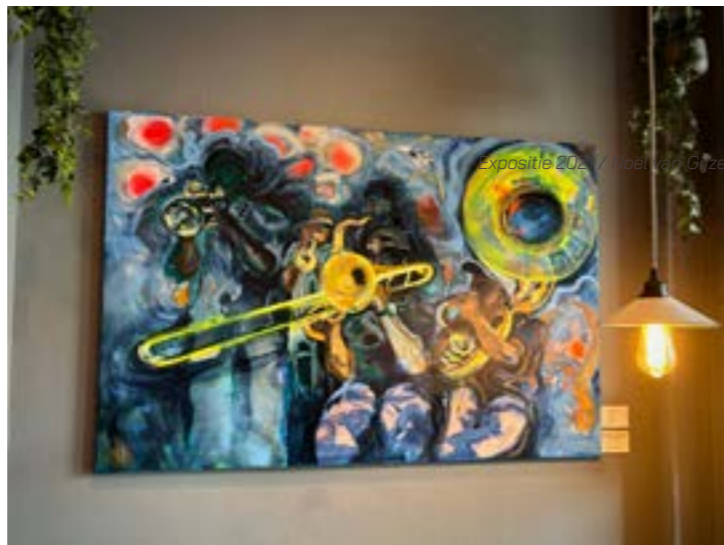
Expositie Liesbeth Schouten