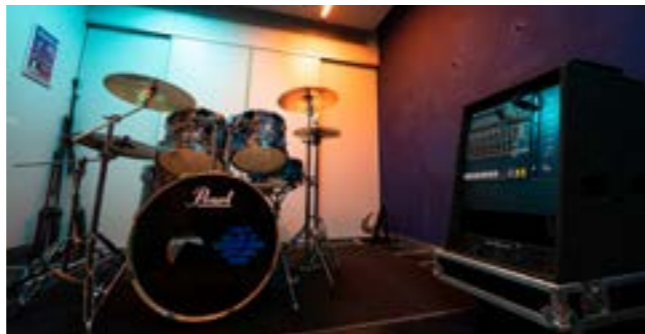
Oefenruimte 2 / Antoine Julien