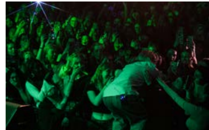
BLOO / Lowbattery Photography